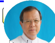
พี่น้องที่รัก